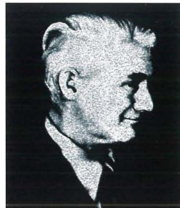
James B. Lansing

Diversamente da qualsiasi altro produttore di componenti e diffusori car audio completi il logo JBL viene identificato in modo istantaneo in tutto il mondo come sinonimo della massima qualità nella riproduzione sonora "mobile". Fin dai giorni ormai lontani delle prime "immagini parlanti" JBL ha svolto e svolge il ruolo di forza trainante verso le tecnologie più creative, il vero fondamento dell'industria del tempo libero come noi la conosciamo oggi.